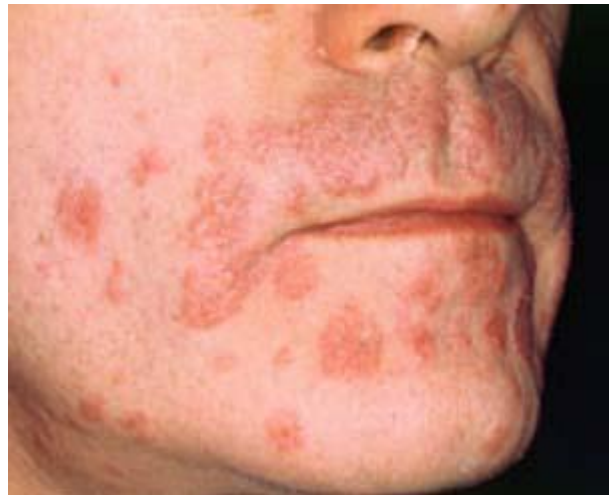
(۴) عفونت تیخالی

ابتدا به صورت احساس سوزش و خارش در محل به وجود می آید. بر اساس اینکه شدت بیماری در چه حدی باشد، به دنبال این احساس های اولیه، ناحیه ای ورم کرده در آن قسمت به وجود می آید. سپس این قسمت دردناک می شود و وقتی دست به آن زده شود بسیار دردناک می شود. در نهایت این ناحیه چرکین می شود و از خود مایع شفاف را به بیرون می دهد و سپس به مدت یک هفته تا ده روز خوب می شود. این زمان از شخصی به شخص دیگر متفاوت است.